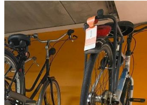
Voorbeeld overschrijden termijn 28 dagen in bewaakte fietsenstalling