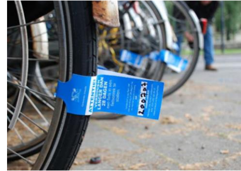
Voorbeeld handhaving in publieke buitenruimte